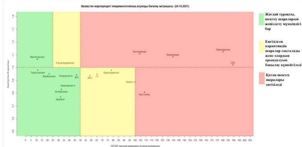
Казахстан өңірлеріндегі эпидемиологиялық ахуалды бағалау матрицасы (24.10.2021)

По состоянию на 24.10.2021 по регионам РК: