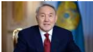
7 января 2021, 08:37

Первый Президент Казахстана Нурсултан Назарбаев поздравил казахстанцев с праздником Рождества , передает zakon.kz со ссылкой на сайт Елбасы.