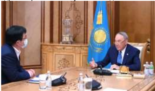
24 ноября 2020, 18:48

Елбасы доложили о предпринимаемых Фондом мерах по развитию современного медицинского образования, здравоохранения и научно-исследовательской деятельности.