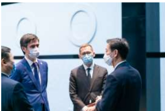
Корейской страны и позвольте выразить благодарность высшему руководству Южной Кореи за предоставленную