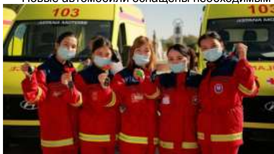
2 октября 2020, 16:04

Новые автомобили оснащены необходимым инвентарем для оказания первой медицинской помощи пациентам.