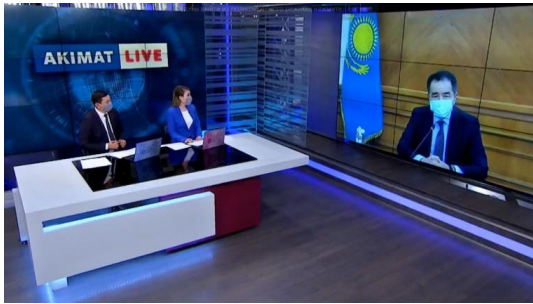
Фото : Кадр из видео 19 августа 2020, 20:23

Аким Алматы рассказал про перепрофилирование гостиниц под ковидные госпитали Мы начали работу по обеззараживанию - Сагинтаев.