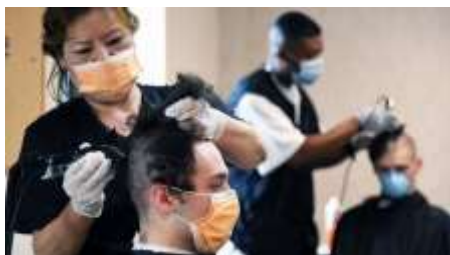
В парикмахерской небольшого американского города произошла примечательная история, которая на практике показывает, что ответственный подход к профилактике COVID-19 может приносить плоды.

Врачи считают, что этому способствовало строгое соблюдение масочного режима и других мер профилактики.